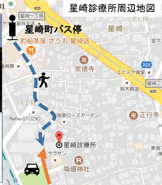
星崎診療所周辺地図